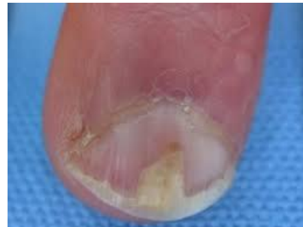
onycholysis aan de vingernagels