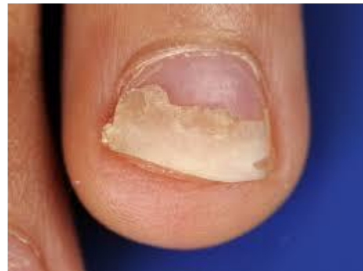
onychomadesis aan de vingernagels en aan een teennagel