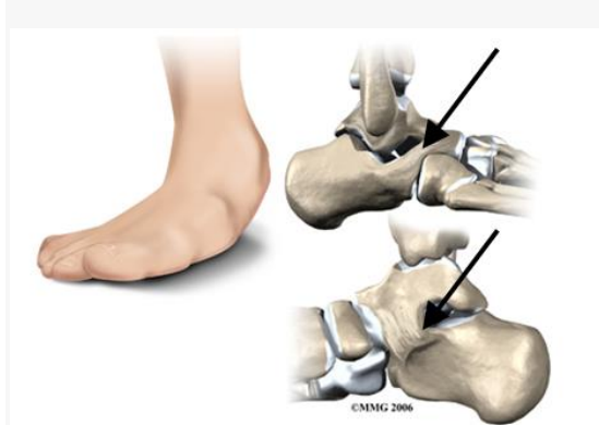
stugge platvoet met vergroeiing bij de pijltjes

Een stugge platvoet is er vaak sprake van een aangeboren vergroeiing in de voet. Onderzoekers schatten dat 3 tot 5% van alle mensen geboren worden met zo'n vergroeiing. Veel mensen zullen nooit weten dat ze deze vergroeiing aan hun voet hebben omdat ze nooit klachten krijgen.