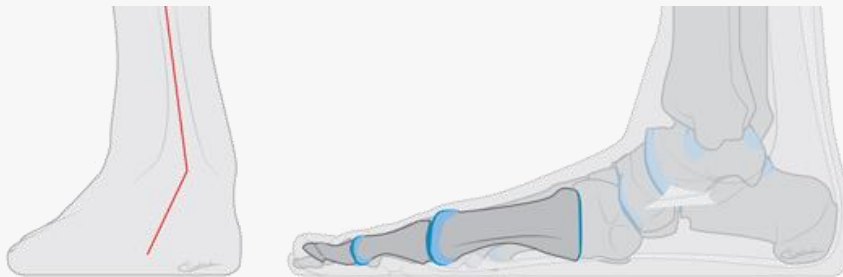
Platvoeten bij kinderen

Het woord zegt het al; een platvoet is een 'platte' voet. Het holletje dat normaal zichtbaar is onder de voet, is niet meer zichtbaar. De voet is ingezakt, de enkel staat wat naar binnen en de hiel wijst naar buiten.