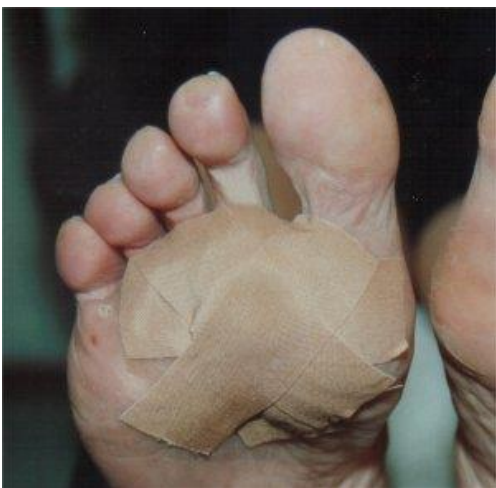
Chemische pakking, behandeling met salicylzalf