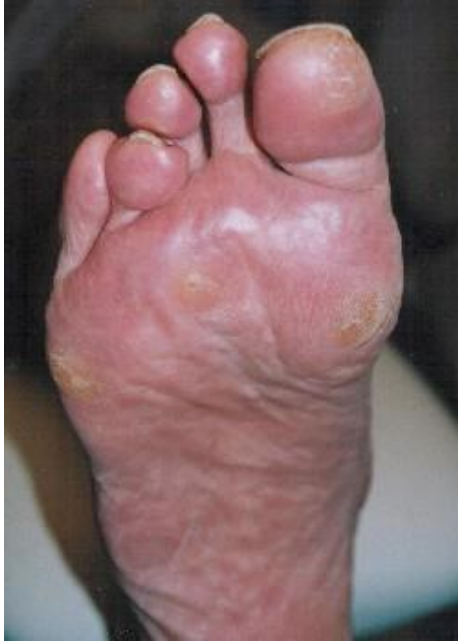
Likdoorn onder de bal van de voet, tevens drie eeltplekken en ruiterteen