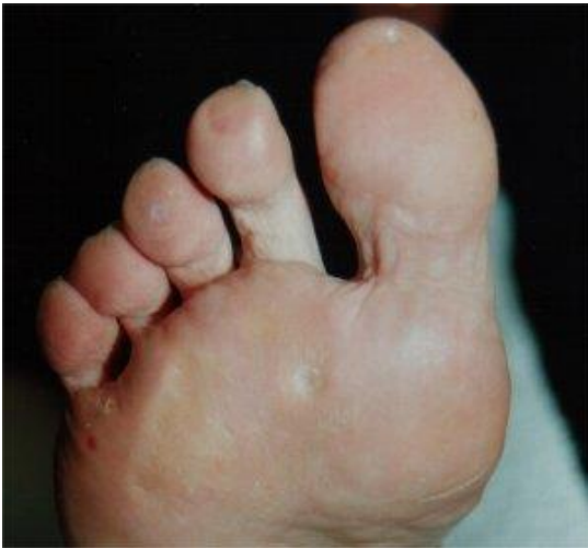
De neurovasculaire likdoorn voorzichtig uitgepit