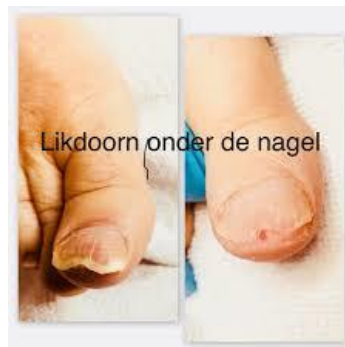
Likdoorn in de nagelwal en onder de nagel