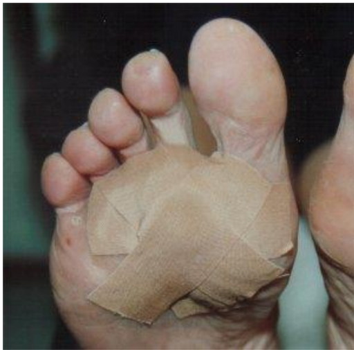
Voorbeeld chemische pakking, behandeling met salicylzalf

de plek opnieuw onderzoeken en beslissen wat verder te doen. Bij diabetici en bij infecties kan deze behandeling niet worden toegepast.