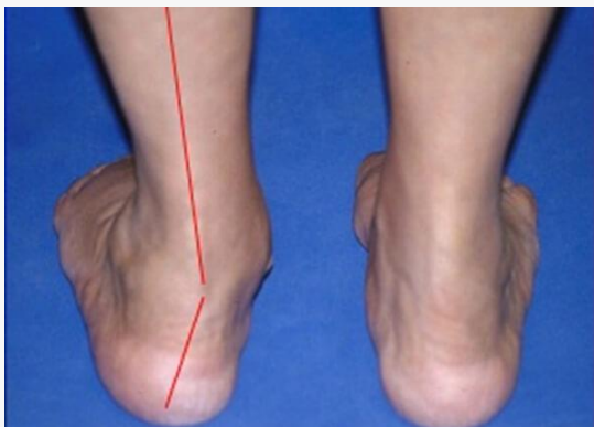
Voorbeeld van een platvoet

Ongeveer 10% van de volwassenen heeft een platvoet. Een platvoet geeft vooral klachten als de voet eerst normaal was, maar in de loop der jaren platter is geworden.